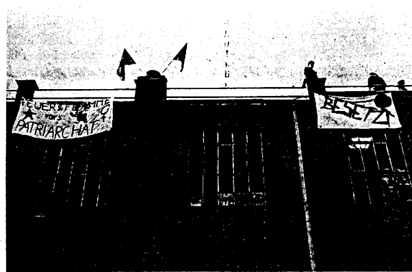
Für einen Tag besetzt: Die alte Fabrikhalle der ehemaligen Federnfabrik in Wieblingen.