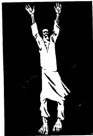
„Hilf!“ Plakat zur Hungersnot in Rußland, 1921

In der Sowjetunion bahnt sich ein weiterer in einer langen Reihe von gefürchteten Hungerwintern an. Die Lebensmittelrationen in den Städten gleichen denen der Kriegsjahre im 2. WK, liegen mancherorts noch darunter auf Gefangenennorm. Bereits werden Vergleiche zur "Zeit der Wirren" anfangs des 17. Jh. angestellt, in der Hungersnot mit Chaos einherging, und daraus beängstigende Konsequenzen gezogen. Selbst unter Breshnev, gar Stalin sei es "besser" gewesen, ist mit Andeutung darauf, bei größerer Ordnung funktionierte auch die Versorgung, zu vernehmen. In der Tat ergänzen sich der Zusammenbruch des zentralen Sammel- und Zuteilungssystems mit dem Bestreben der Republiken handelsbare Güter zwecks einträglicherer Veräußerung zu horten, zu einem Szenario, in dem zur Durchsetzung der (Verteilungs)